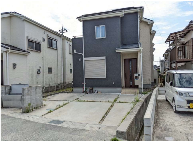
車2台+バイクの駐車も可！